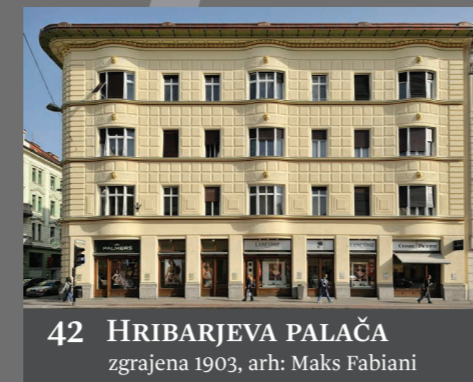
42 HRIBARJEVA PALAČA zgrajena 1903, arh: Maks Fabiani