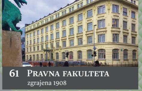
61 PRAVNA FAKULTETA zgrajena 1908