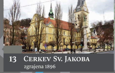
13 CERKEV SV. JAKOBA zgrajena 1896