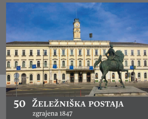
50 ŽELEŽNIŠKA POSTAJA zgrajena 1847