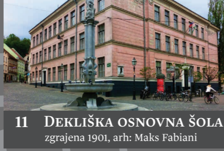
11 DEKLIŠKA OSNOVNA ŠOLA zgrajena 1901, arh: Maks Fabiani