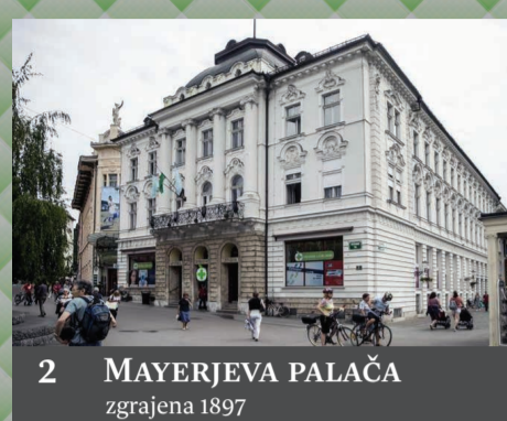
2 MAYERJEVA PALAČA zgrajena 1897