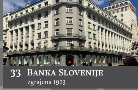
33 BANKA SLOVENIJE zgrajena 1923