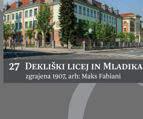
27 DEKLIŠKI LICEJ IN MLADIKA zgrajena 1907, arh: Maks Fabiani