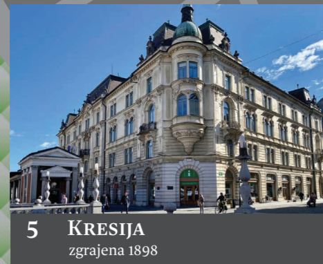
5 KRESIJA zgrajena 1898