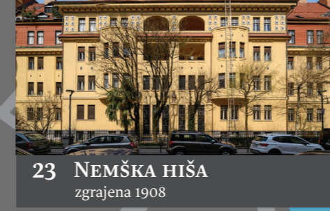
23 NEMŠKA HIŠA zgrajena 1908