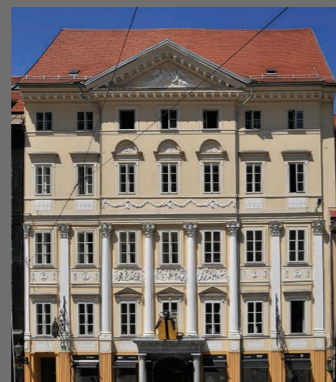
7 SOUVANOVA HIŠA prenovljena 1901