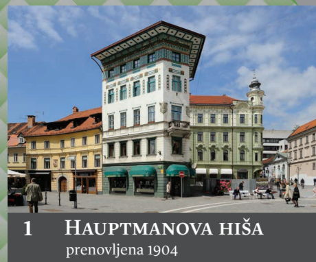
1 HAUPTMANOVA HIŠA prenovljena 1904