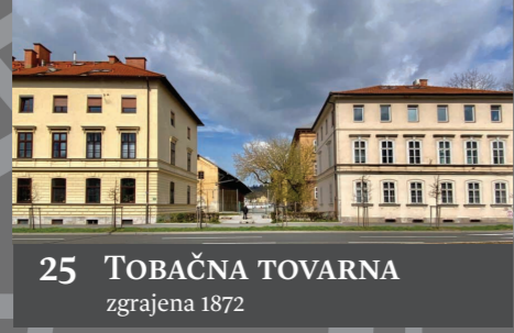
25 TOBAČNA TOVARNA zgrajena 1872