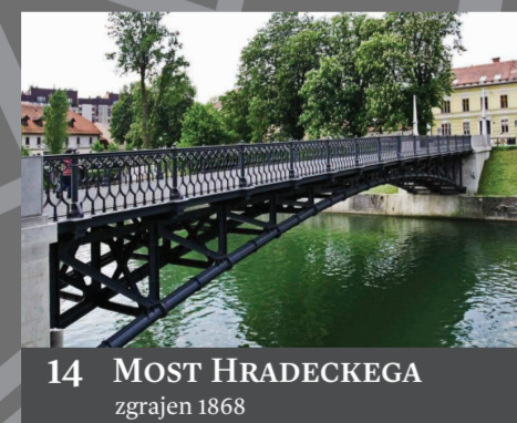
14 MOST HRADECKEGA zgrajen 1868