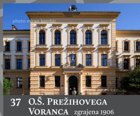
37 O.Š. PREŽIHOVEGA VORANCA zgrajena 1906