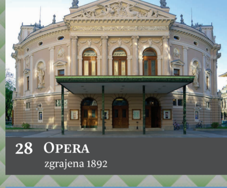
28 OPERA zgrajena 1892