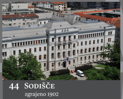
44 SODIŠČE zgrajeno 1902