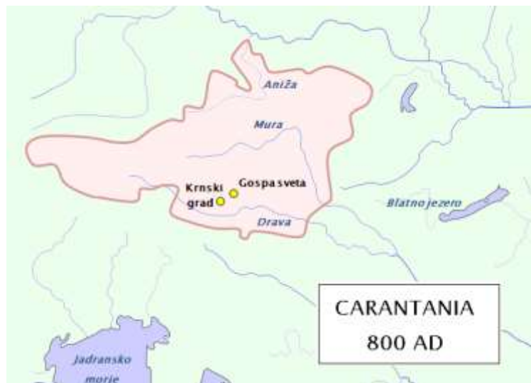
Bayern med Karantanien fram till året 976

Året 743 bad Karantanierna Östfrankerna, och de germanska Bajuvarerna som ingick i det frankiska riket, om hjälp för att slutgiltigt fördriva Avarerna från sina närområden. Karantanierna fick Bajuvarernas hjälp mot löftet att erkänna deras överhöghet. Projektet lyckades så bra att namnet Avarer några decenier senare inte längre nämns i några historiska dokument.