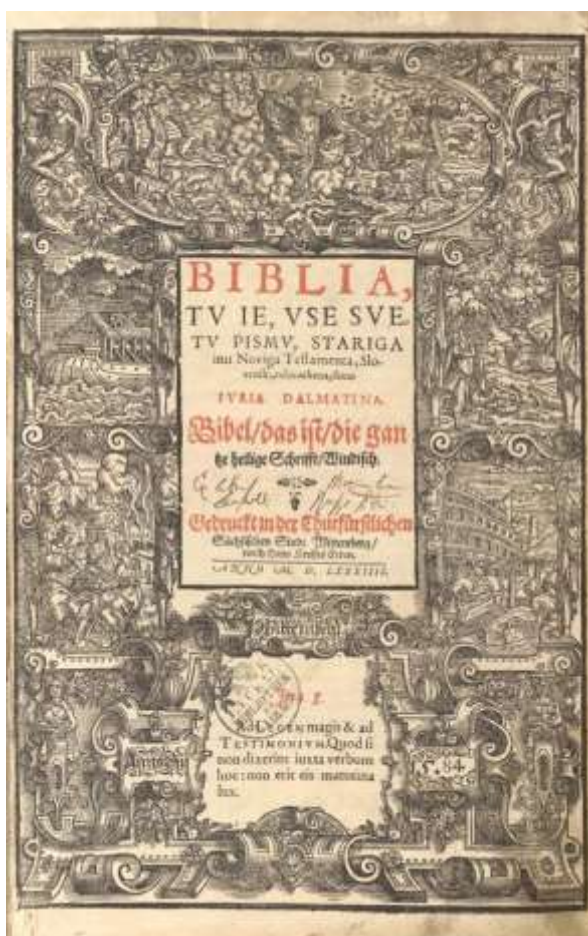
Slovensk bibel av Jurij Dalmatin (*1547, +1589)

Primož Trubar (*1508,+1586) Jurij Dalmatin (*1547, +1589) översatte och gav året 1583 i Tübingen ut hela Bibeln på slovenska, ett kulturmärke som gav Slovenerna plats bland utvecklade europeiska nationer.