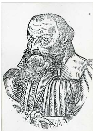
Primož Trubar (*1508, +1586)

Primož Trubar (*1508,+1586) Jurij Dalmatin (*1547, +1589) översatte och gav året 1583 i Tübingen ut hela Bibeln på slovenska, ett kulturmärke som gav Slovenerna plats bland utvecklade europeiska nationer.