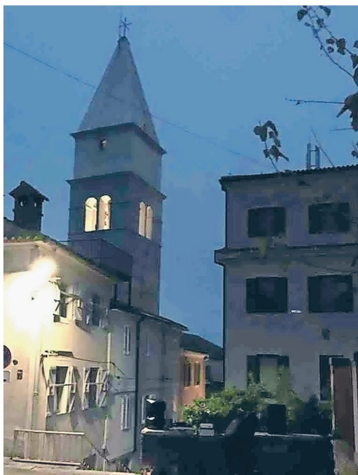
Po vstopu skozi zvočni portal Bolniške ulice, ki je bil oblikovan z glasbo "Klic glasov" in "Ko pride Mario", smo doživeli melodijo treh zvonov cerkve sv. Frančiška.